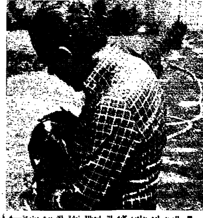
المعد انه يدام كلبه المشاطلة نهاية الاسبوع بمرسته في «عنا»